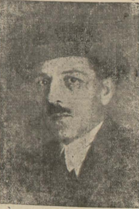
Hariciye Vekilimiz B. Şükrü Saracoğlu

Komşularımızın ve müttefiklerimizin yüksek devlet adam